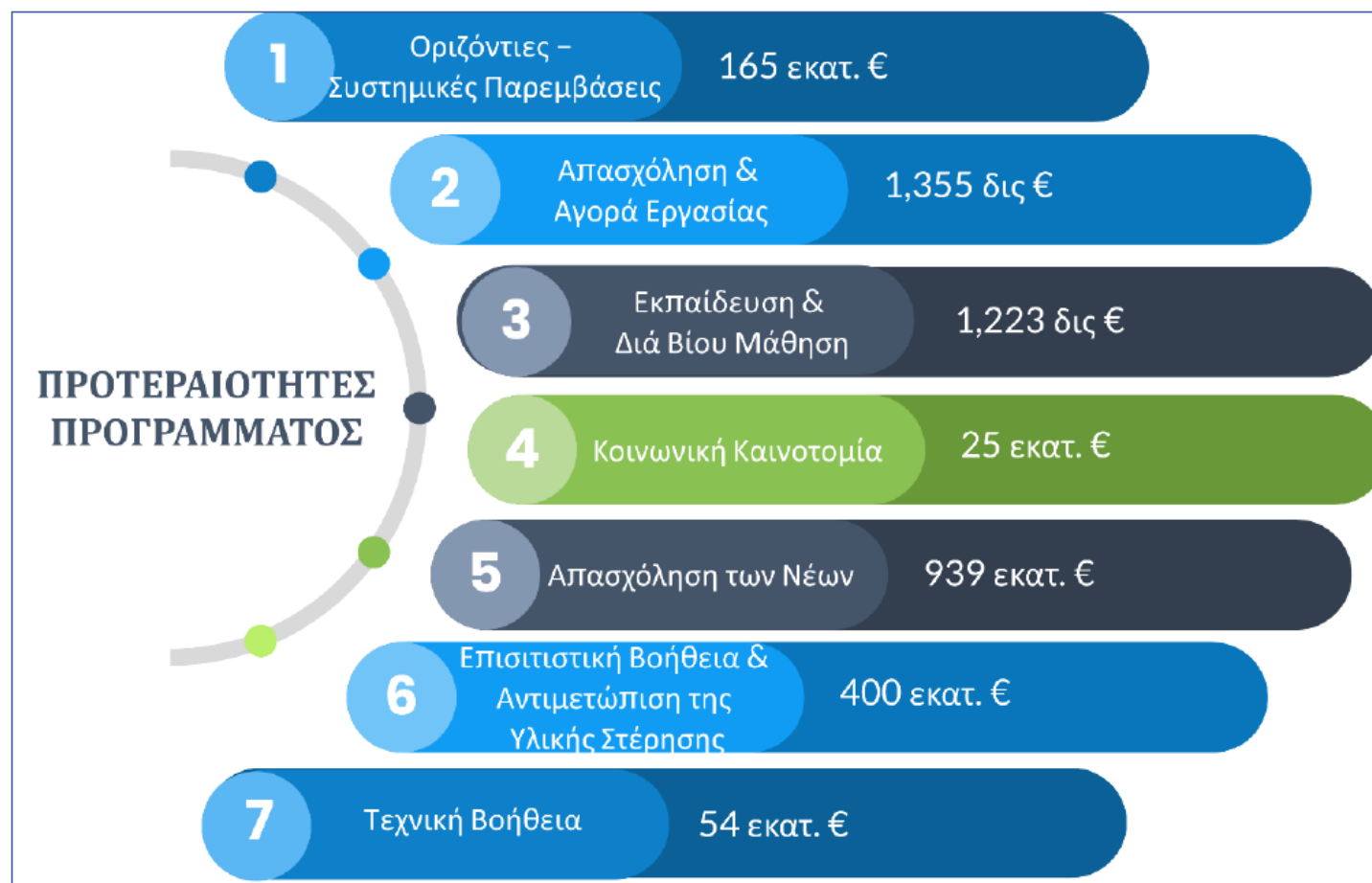
Διάγραμμα 2: Προτεραιότητες ΕΠ ΕΠΑΝΑΔ 2021-2027